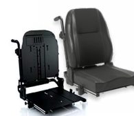
Rücken: ARH 2172 bzw. 2173